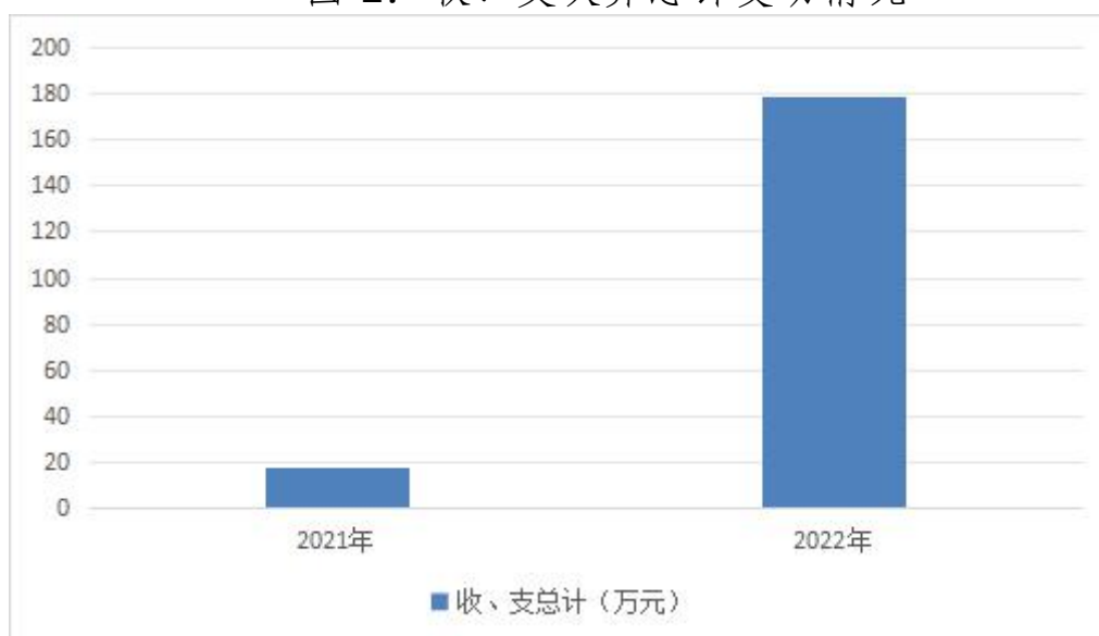
图 1: 收、支决算总计变动情况

2022 年度收、支总计均为 178.67 万元。与 2021 年度相比，收、支总计增加 17.54 万元，增长 9.81 %，主要原因是人员基本工资福利增加。